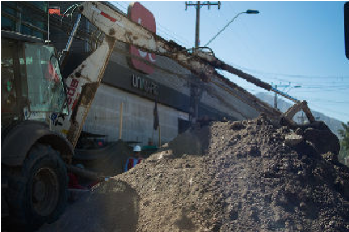
Foto 3: Equipos de limpieza con maquinaria pesada frente a uno de los principales supermercados de la ciudad

La gente siente rabia, un taxista nos dijo que "hay lugares con una pared de barro de más de un metro y medio de altura, las autoridades están 'limpiando' las calles con aguas oscuras. Los canales de televisión solo mostraron menos del 10% de lo que realmente sucedió. No pueden decir que el 80% de la situación ha vuelto a la normalidad, ¡¡¡eso es falso!!!!, necesitan controlar los precios, aquí después del desastre está todo demasiado caro", dijo. Él no es el único que se siente así. Otro taxista tiene un punto de vista diferente: "las autoridades están trabajando duro", dijo.