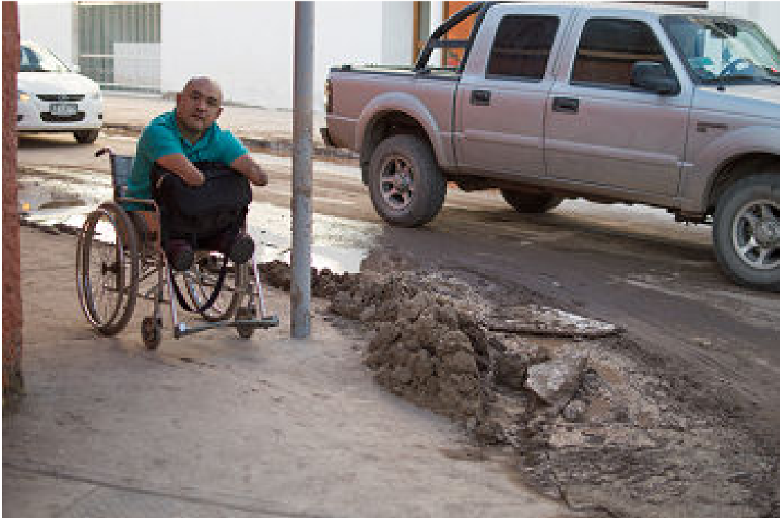
Foto 5: Se perdió la infraestructura urbana, como la accesibilidad en las esquinas de las calles, por Esteban Iriarte