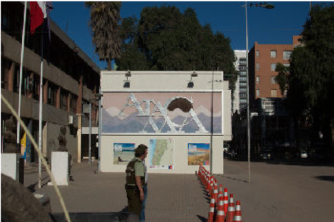
Foto 7: Intendencia de la región de Atacama, sede del Gobierno regional, por Esteban Iriarte

No había refugios para todos. La primera razón es que para tener refugio hay que llegar al lugar adaptado como refugio, lo que es imposible para una persona que utiliza una silla de ruedas, cuando las calles están cubiertas por capas profundas de barro o cuando están destrozadas. Nos contaron el caso de una persona que estaba amputada, pero que fue capaz de llegar a uno de los refugios oficiales. Lo rechazaron porque el refugio no estaba "adaptado" para él. Dejaron a este hombre en el segundo piso de una casa dañada, porque el primer piso estaba cubierto de lodo.